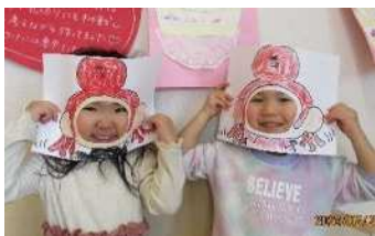
きいろのバナナさん