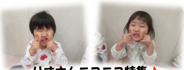
りすさんニコニコ特集🎵