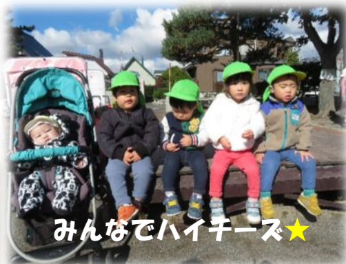
みんなでハイチーズ★