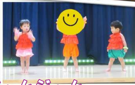
ハッピージャムジャム